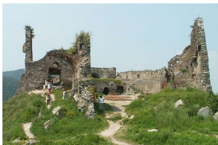
Déva vára napjainkban

Már életemben rengeteget utaztam, de ez mindig autóval, villamossal és busszal történt. Ámde április 11-én elmentünk Kolozsvárig autóval, mert Kolozsváron fel kellett szállnunk egy vonatra, ami Dévára vitt minket. Már Kolozsvár felé az autóban izgultam, hogy milyen is lesz ülni. Beteg leszek-e, vagy nem, hisz az autókban mindig beteg szoktam lenni. Végül megérkeztünk Kolozsvárra, és felszálltunk a vonatra. A vonat lépcsője kissé magas volt, ámde megbirkóztunk vele, hiszen egy kedves néni megfogta a kezünket és felsegített. Eleinte még nem tudtuk, hogy ki lehet az a néni, ám mikor kerestük azt a fülkét, amelyikbe kell üljünk, kiderült, hogy ő a tanítónéninknek egy régi barátnője, akinek az osztályából 4 gyerek nyert Dévára egy utazást a Fürkészőtől, ugyanúgy, mint mi. Először is illendően bemutatkoztunk egymásnak, és összebarátkoztunk a gyerekekkel. Kiélveztük a gyönyörű tájat,