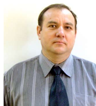
NYESTE ÁRPÁD karbantartó