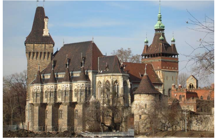
...a várak királya

Szombaton, reggeli után, elindultunk Vajdahunyad várához. Amikor odaérteztünk, először Hunyadi Mátyásnak az egykori tartózkodási helyét néztük meg. Azután ellátogattunk a vár kápolnájába, ahol Hunyadi Jánosnak a sírmásolata volt kifaragva márványból. A várban az egyik legpompásabb hely a Trónterem, ahol szinte minden márványból volt. Ebben a teremben egy bácsi egy Hunyadi János korabeli zenét játszott xilofonon. Itt volt a Hunyadi család összes címere, és a trónon gyönyörű faragások látszottak. A Trónterem után megnéztük a Kisasszonyok Termét. Bethlen Gábor erdélyi fejedelem nevezte el ezt a termet, mert az udvarhölgyek, akik megfordultak a várban, ebben a teremben szálltak meg. Ezután lementünk az udvarra, ahol megnéztük a vár kútját. Erről a kútról egy érdekes mondát ismerek, amely így szól: Az oszmán török birodalom idején a törökök sokat ostromolták