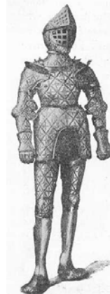
II. Lajos páncélja