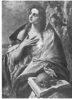
Fordította: Hari László

A legszentebb könyvben fennmarad emléked. A gyönyörök szûnnek. Átültették volna? Mária Magdolna bejár mindenséget, Bûnök terhe alatt szép Mária Magdolna.