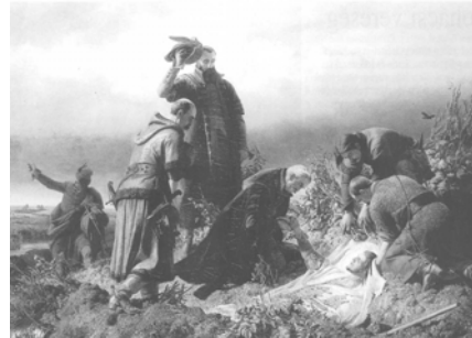
Székely Bertalan: II. Lajos holttestének megtalálása

A királyi sereg a csata napján a mohácsi síkságot délről szegélyező dombor előtt állt hadrendbe kora reggel, a törökök azonban csak délután négy óra körül jelentek meg rendezetlen sorokban menetelve, akiket a kinevezett fővezér, Tomori Pál azonnal megtámadott. Az első