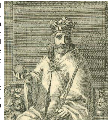
Szapolyai János király