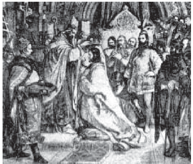
Szent István megkoronázása